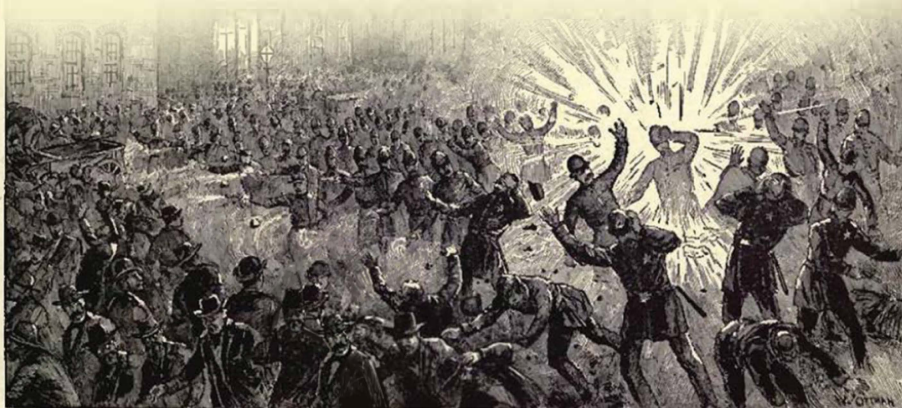
THE HAYMARKET RIOT. THE EXPLOSION AND THE CONFLICT. * The original illustration were edited by the artist to reflect more accurate events.

μέσα από το πλήθος, μια αυτοσχέδια βόμβα ρίχτηκε στην ομάδα των αστυνομικών, σκοτώνοντας και τραυματίζοντας αρκετούς αστυνομικούς. Στη συνέχεια, η αστυνομία άνοιξε πυρ εναντίον του πλήθους, χτυπώντας μάλιστα πολλούς δικούς τους.